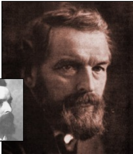
Silvio Gesell (1862–1930)

Dieses Flugblatt entspringt einer privaten Initiative und wurde privat finanziert, lediglich um die Idee der Freiwirtschaft bekannter zu machen oder sogar eine konstruktive Diskussion darüber auszulösen.